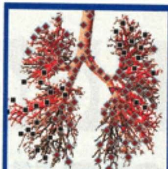
Erfolg der Vektor- Therapie: gesunde Lungen

Verstärkte Wirkung. Die Vektor-Therapie besteht