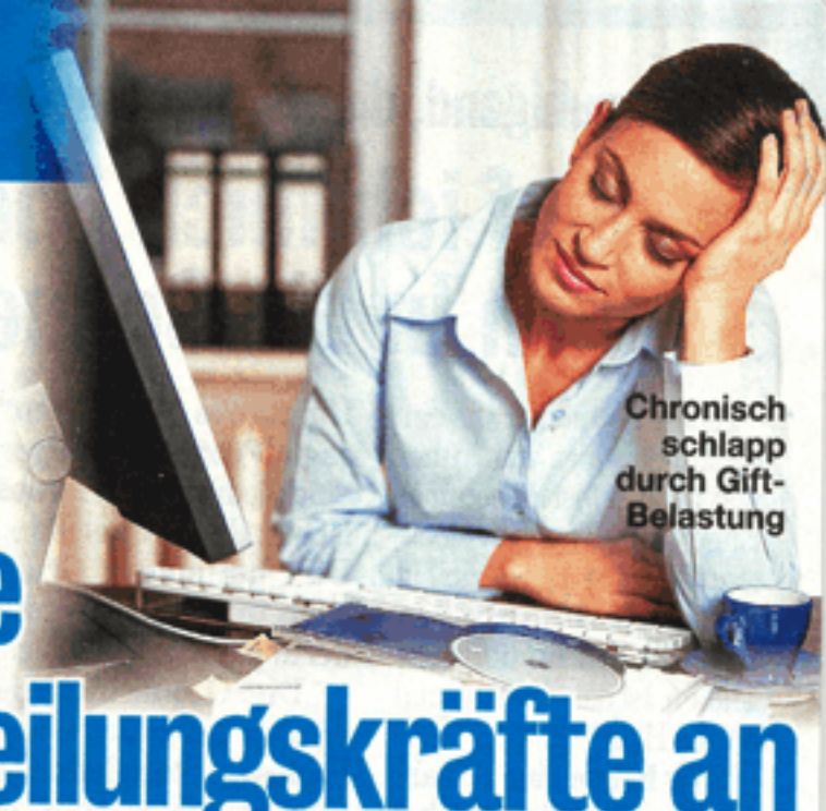
Chronisch schlapp durch Gift- Belastung