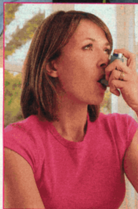
Ständige Luftnot: Eine chronische Vergiftung kann schweres Asthma auslösen